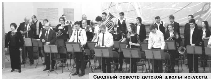
Сводный оркестр детской школы искусств.