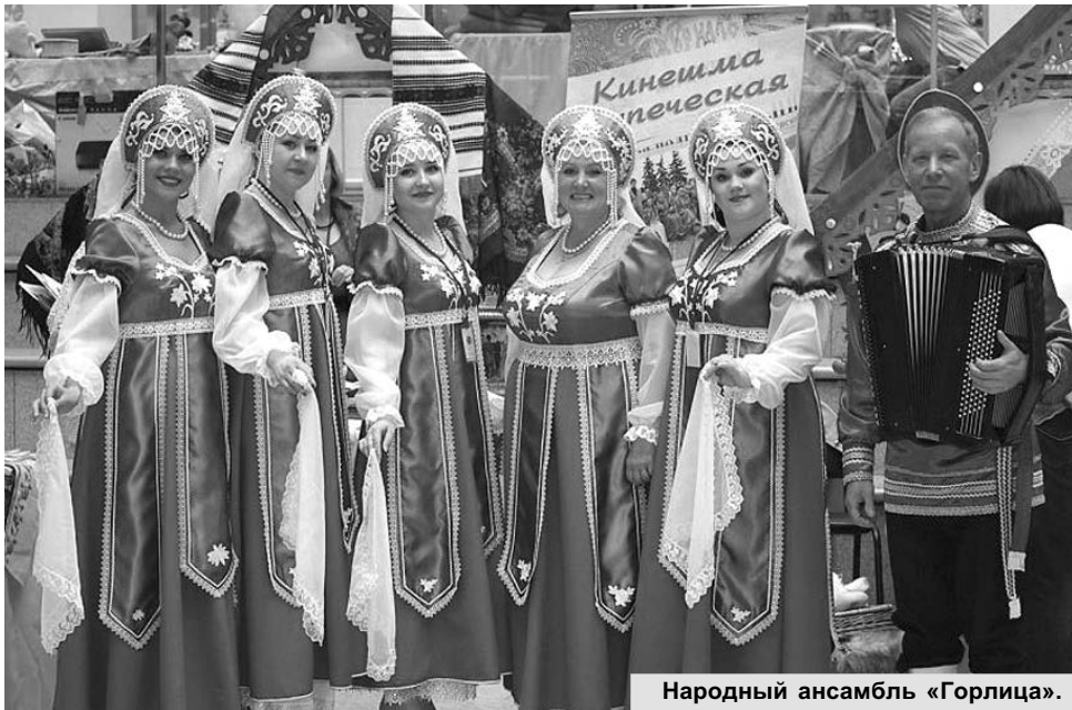
Народный ансамбль «Горлица».

В клубе активно работают тридцать любительских объединений: пятнадцать творческих коллективов и пятнадцать клубов по интересам. Мы постарались охватить все возможные досуговые направления от