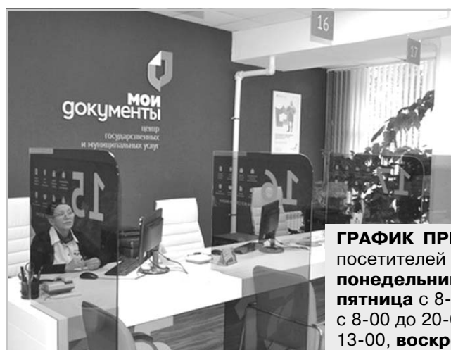
ГРАФИК ПРИЁМА посетителей МФЦ г. Кинешмы: понедельник, среда, четверг, пятница с 8-00 до 18-00, вторник с 8-00 до 20-00, суббота с 8-00 до 13-00, воскресенье – выходной.

Сразу два нововведения действуют с начала года при регистрации автовладельцами транспортных средств.