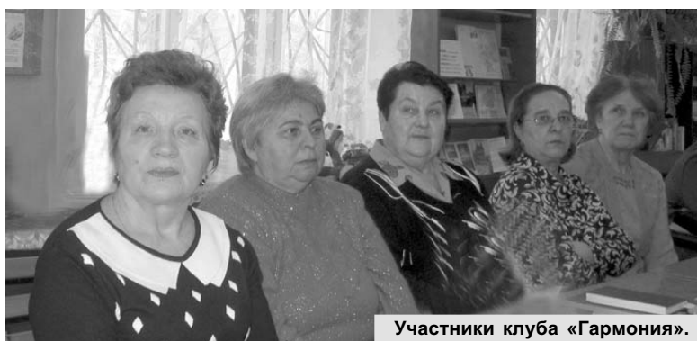
Участники клуба «Гармония».

теки читали стихи, исполняли душевные песни о родном крае, делились воспоминаниями, размышляли.