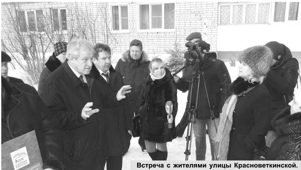
Встреча с жителями улицы Красноветкинской.

первых, которые попадут в партийную программу.