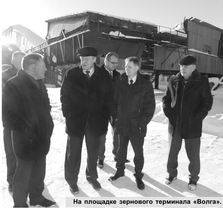
На площадке зернового терминала «Волга».

Встреча со старшеклассниками Кинешмы носила необычный характер и прошла в популярном формате ток-шоу. Депутату было предложено стать участником программы «100 вопросов взрослому». Но сначала школьники поделились