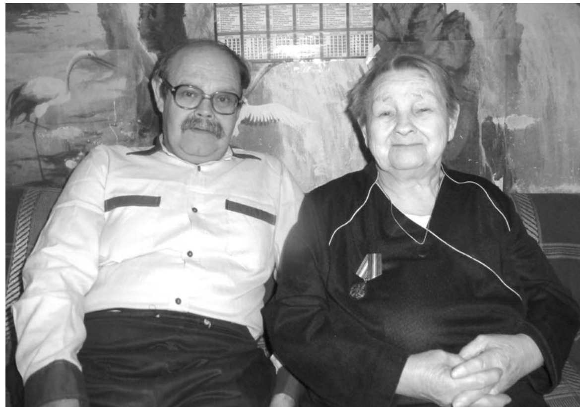
● ЛЮДИ И СУДЬБЫ