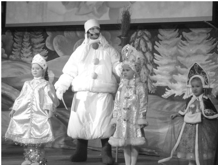
● «МАЛЕНЬКАЯ СНЕГУРОЧКА - 2017»