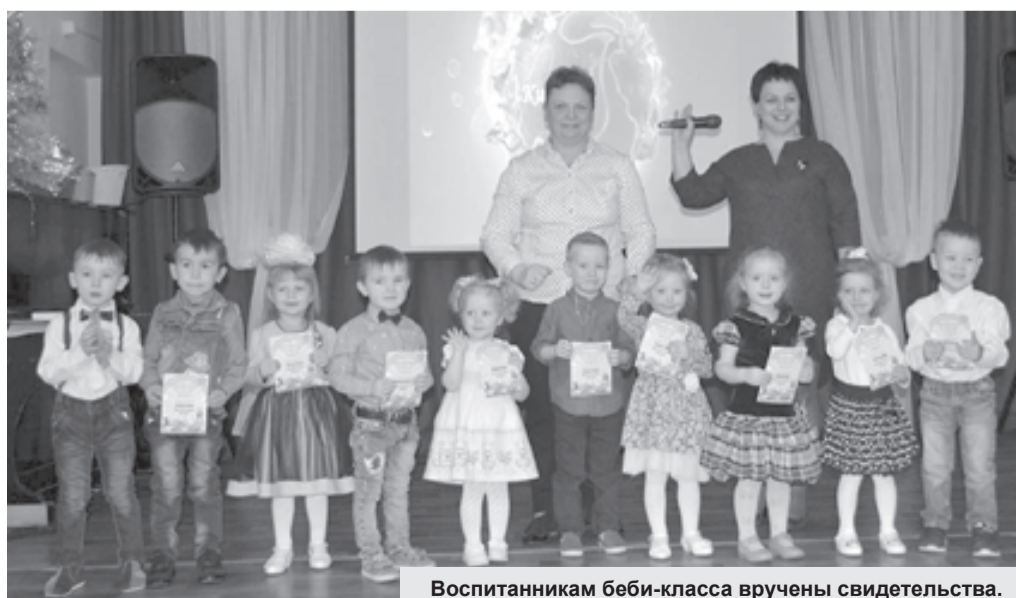
Воспитанникам беби-класса вручены свидетельства.