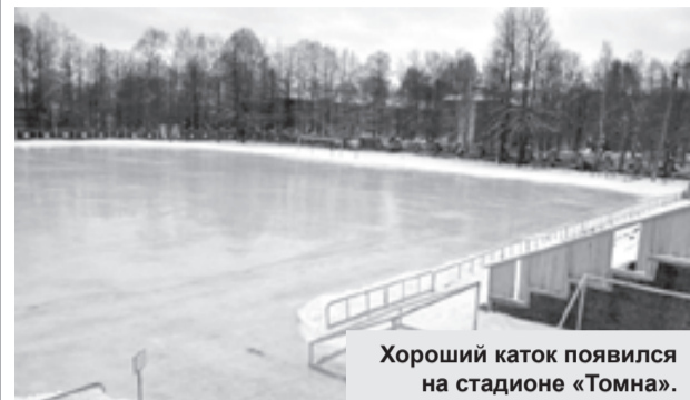
Хороший каток появился на стадионе «Томна».