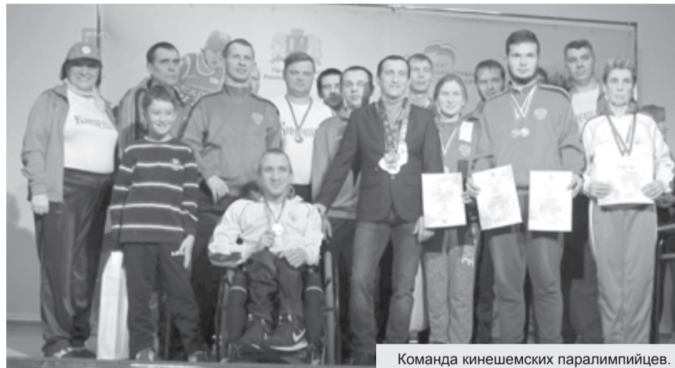
Команда кинешемских паралимпийцев.

в физкультурно-оздоровительном комплексе «Олимпия», на котором присутствовало более 800 человек. Здесь же состоялись первые заезды на колясках. В упорной борьбе наш Ев-