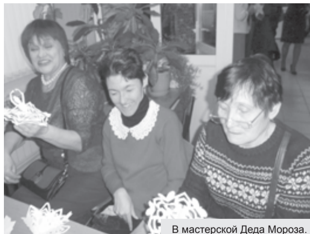
В мастерской Деда Мороза.