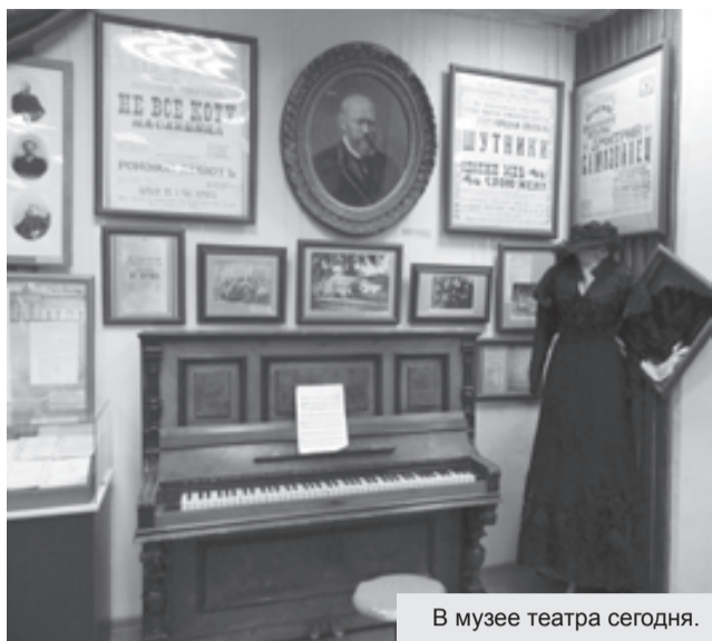
В музее театра сегодня.