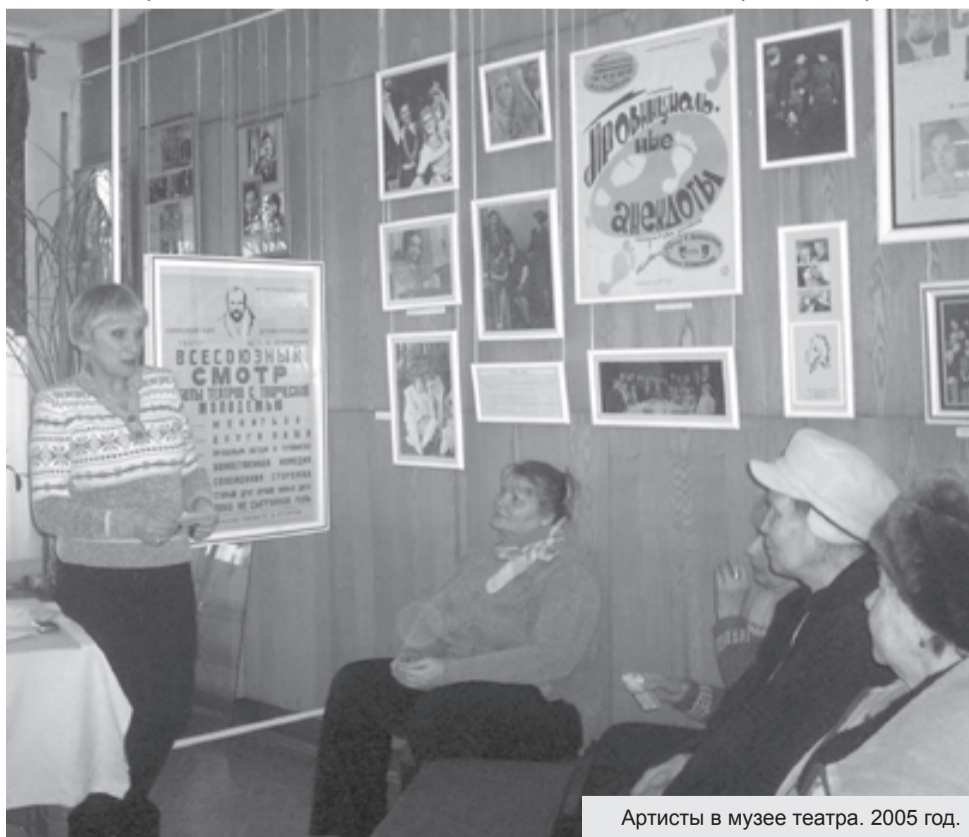
Артисты в музее театра. 2005 год.

В 2010 году в связи с капитальным ремонтом в здании театра экспозиция была демонтирована, все фонды были перевезены на хранение в другое помещение. Но даже в таких условиях продолжалась текущая выставочная, массово-просветительская работа, сбор и исследование материалов: тематические выставки к спектаклям по пьесам А.Н.Островского, к юбилеям творческих работников театра, экскурсии, театральные встречи, лекции.