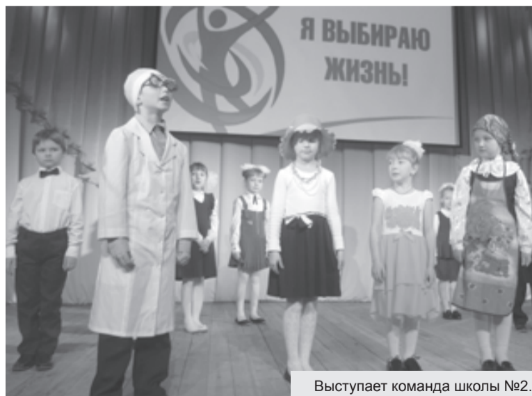
Выступает команда школы №2.

В течение ноября в школах Кинешмы проходила акция «Будем жить». Ее главной целью является пропаганда здорового образа жизни и стремление оградить детей от пристрастия к наркотикам и других пагубных привычек.