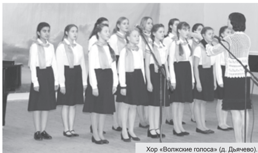
Хор «Волжские голоса» (д. Дьячево).

Красивой финальной точкой VIII областного фестиваля молодежного творчества «Кинешемский Благовестъ», посвященного памяти святителя Василия, епископа Кинешемского, стал концерт лауреатов и почетных гостей в зале детской школы искусств.