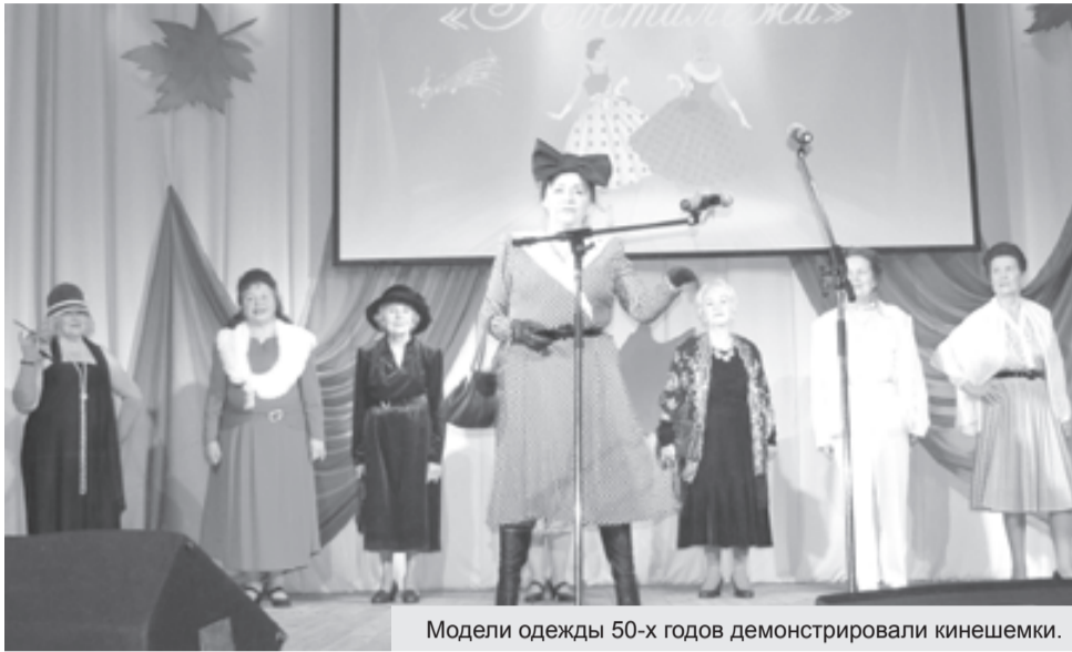
Модели одежды 50-х годов демонстрировали кинешемки.