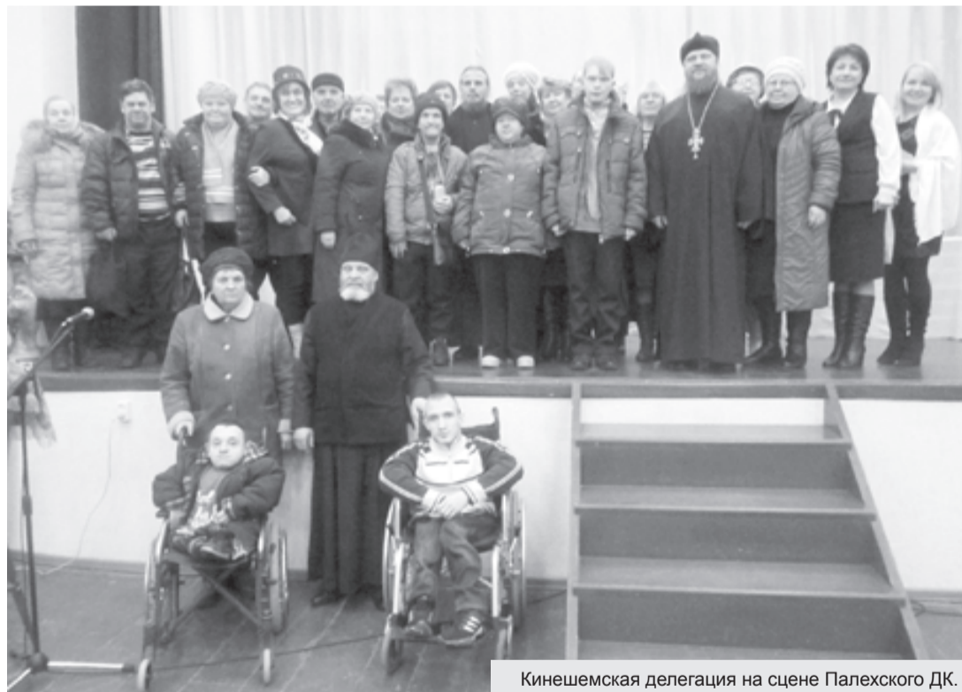
Кинешемская делегация на сцене Палехского ДК.