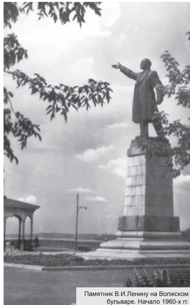
Памятник В.И.Ленину на Волжском бульваре. Начало 1960-х гг.