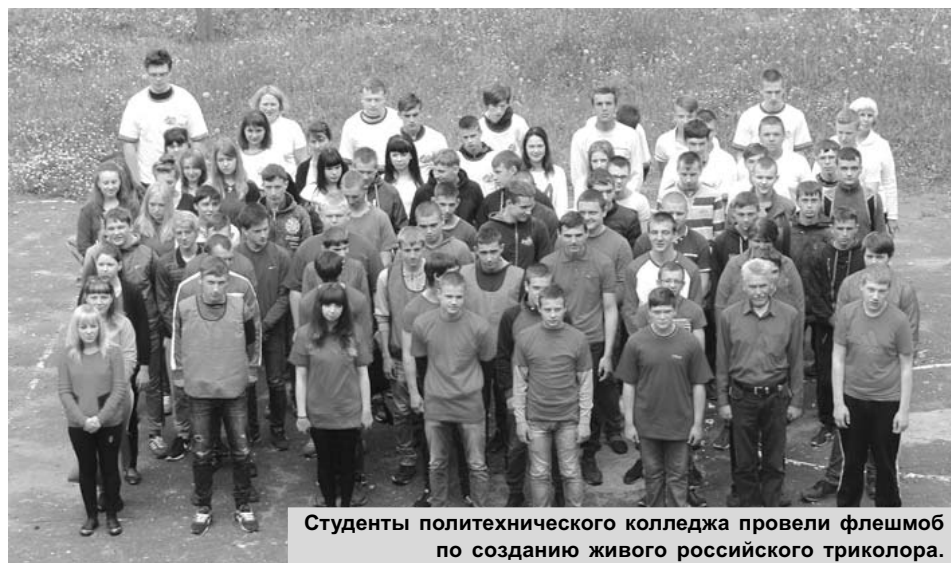
Студенты политехнического колледжа провели флешмоб по созданию живого российского триколора.