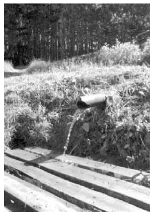
Родник «поет» благодарно и весело.