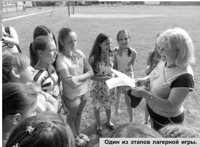
Один из этапов лагерной игры.

Каждый отряд получил задание и отправился в путешествие по станциям. Задания были интересными и разнообразными. Необходимо было правильно прочитать скороговорки, ведь настоящим журналистом должен обладать грамотной и четкой речью, ребята рисовали плакаты и рисунки на заданную тему, вспомнили продолжения известных пословиц.