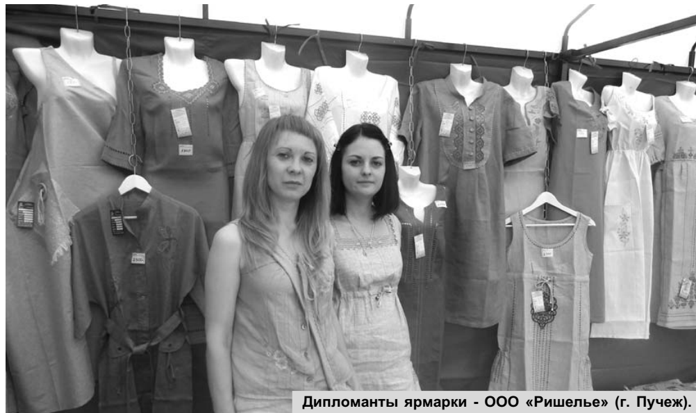
Дипломанты ярмарки - ООО «Ришелье» (г. Пучеж).