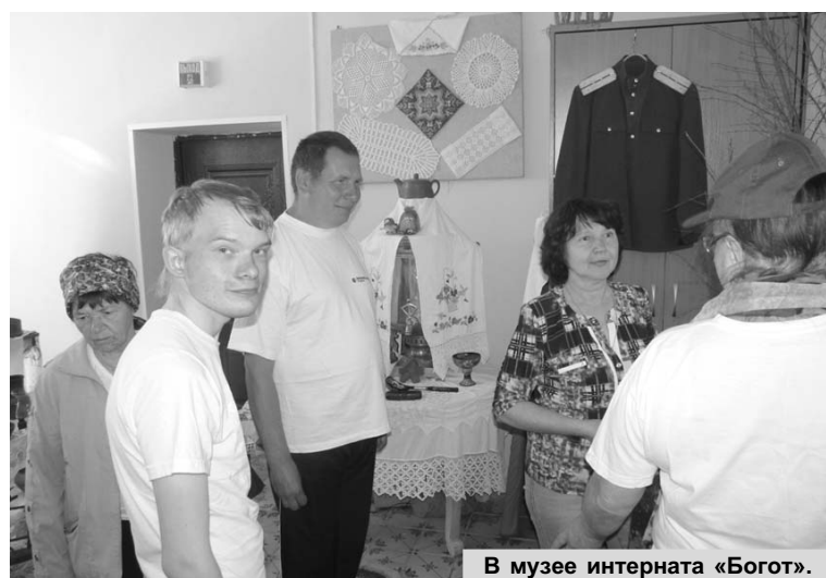
В музее интерната «Богот».