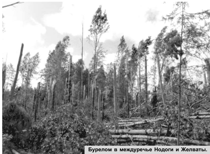
Бурелом в междуречье Нодоги и Желваты.