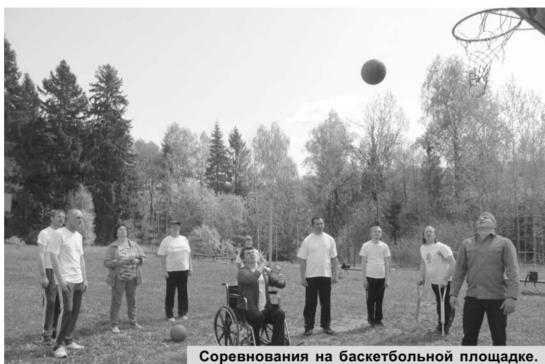
Соревнования на баскетбольной площадке.