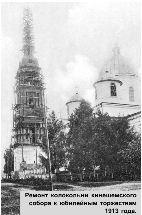
Ремонт колокольни кинешемского собора к юбилейным торжествам 1913 года.