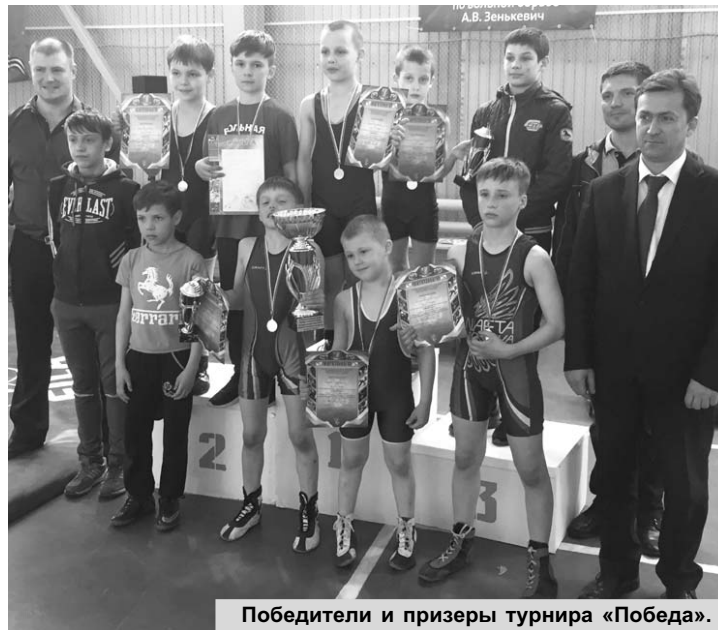
Победители и призеры турнира «Победа».