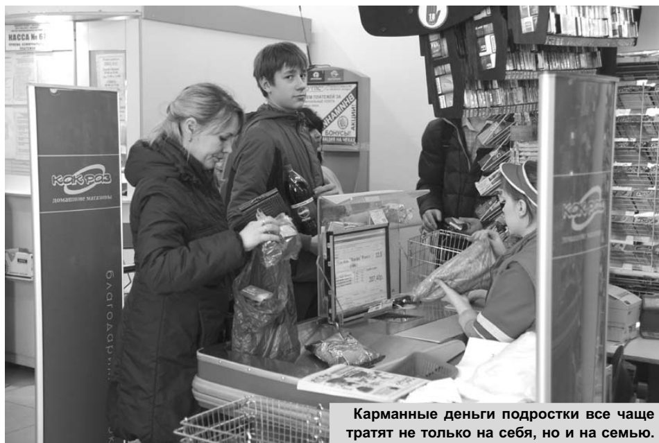
Карманные деньги подростки все чаще тратят не только на себя, но и на семью.

Некоторые люди обращаются за помощью пери-