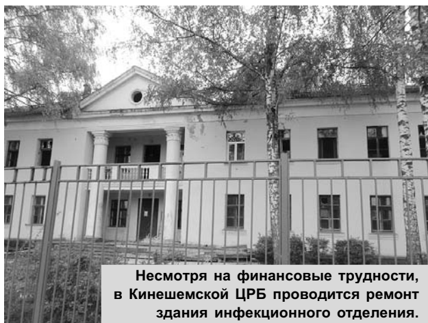
Несмотря на финансовые трудности, в Кинешемской ЦРБ проводится ремонт здания инфекционного отделения.