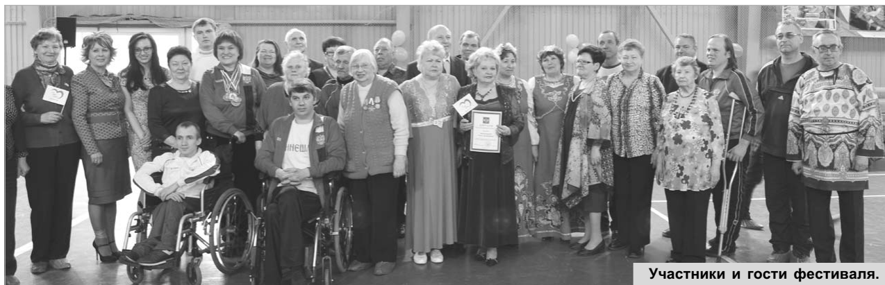
Участники и гости фестиваля.