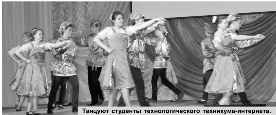
Танцуют студенты технологического техникума-интерната.