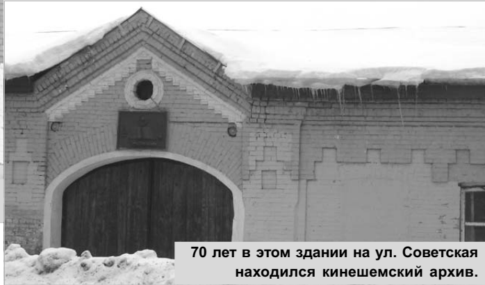
70 лет в этом здании на ул. Советская находился кинешемский архив.

Важна роль архивных учреждений как собирателей и хранителей истории.