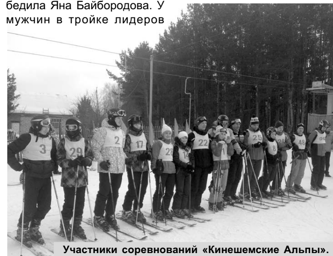
Участники соревнований «Кинешемские Альпы».