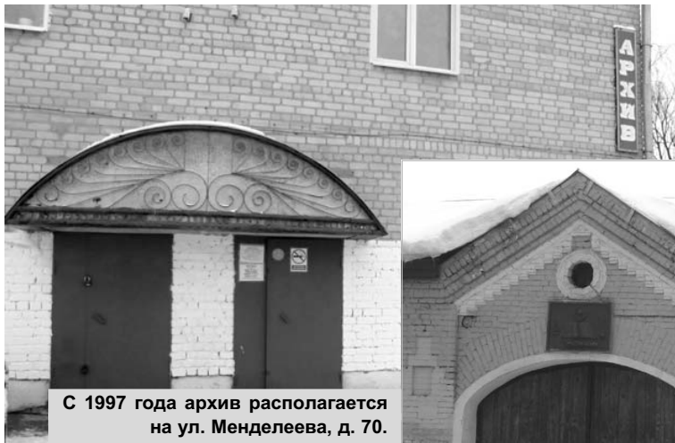
С 1997 года архив располагается на ул. Менделеева, д. 70.