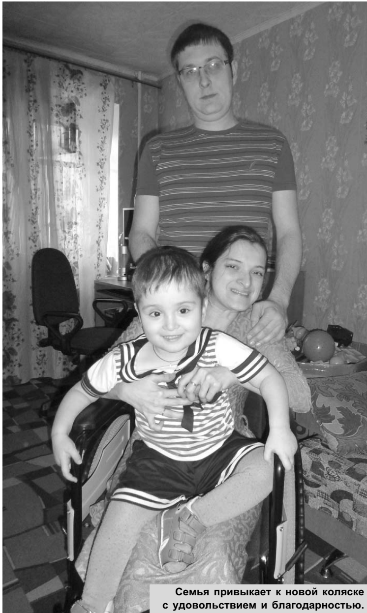
Семья привыкает к новой коляске с удовольствием и благодарностью.