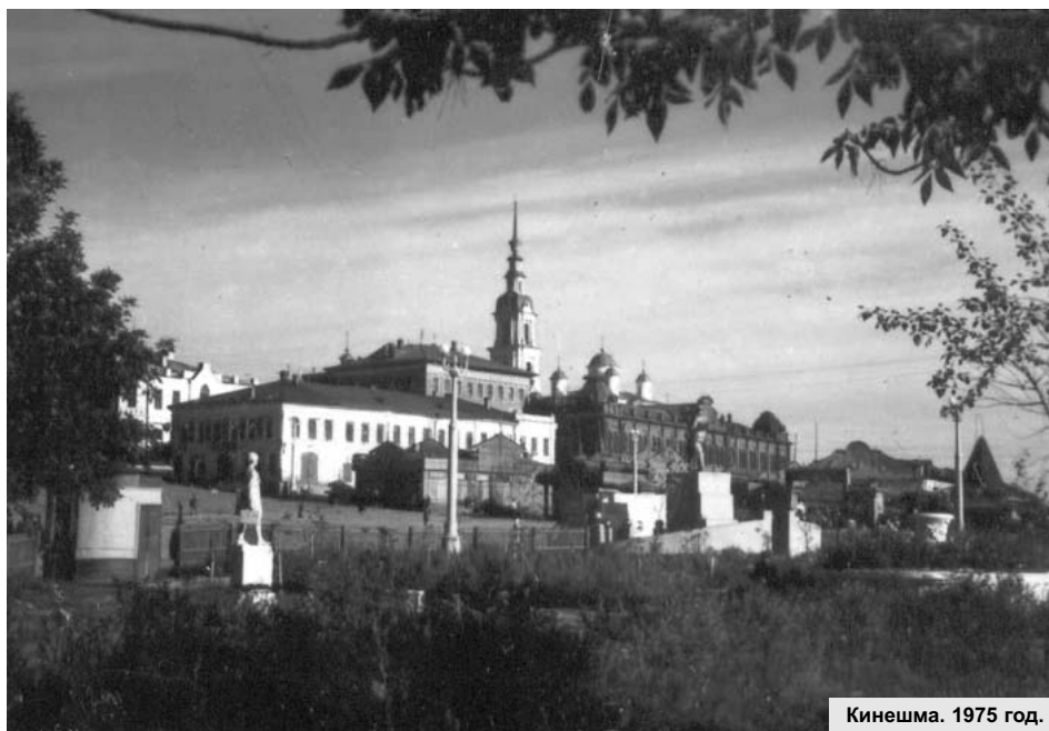
Кинешма. 1975 год.

Обязательствами было предусмотрено завершить задание по выпуску пряжи 30 декабря, но трудовой подъем, царящий в коллективе, мастерство и желание быть впереди позволили на четыре дня раньше срока рапортовать о выполнении.